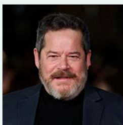
Jorge Sanz Actor