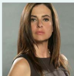
Lola Baldrich Actriz